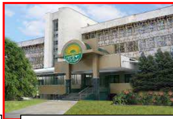
UNIVERSITATEA DE STAT DIN MOLDOVA