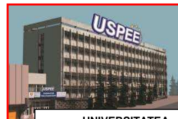
UNIVERSITATEA „C-TIN STERE” DIN MOLDOVA

sau asociatia.vasilepogor@gmail.com sau Tel. 0332 437 107