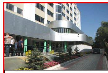
UNIVERSITATEA DE STUDII EUROPENE DIN MOLDOVA

FACULTATEA DE FIZICĂ ȘI FACULTATEA DE ECONOMIE ȘI ADMINISTRAREA AFACERILOR de la UNIVERSITATEA “AL. I. CUZA” DIN IAȘI – ROMÂNIA, FACULTATEA DE ARTE VIZUALE ȘI DESIGN de la UNIVERSITATEA DE ARTE “GEORGE ENESCU” DIN IAȘI – ROMÂNIA, FACULTATEA DE DREPT de la UNIVERSITATEA DE STAT DIN MOLDOVA DEPARTAMENTUL DE LIMBĂ ENGLEZĂ ȘI LIMBĂ FRANCEZĂ DE LA UNIVERSITATEA DE STAT DIN MOLDOVA FACULTATEA DE DREPT de la UNIVERSITATEA DE STUDII POLITICE ȘI ECONOMICE EUROPENE “C-TIN STERE” DIN MOLDOVA, FACULTATEA DE ȘTIINȚE ECONOMICE ȘI FACULTATEA DE LIMBI MODERNE de la UNIVERSITATEA DE STUDII EUROPENE DIN MOLDOVA și ASOCIAȚIA CULTURAL-ȘTIINȚIFICĂ “VASILE POGOR” DIN IAȘI VĂ INVITĂ SĂ PARTICIPAȚI LA :