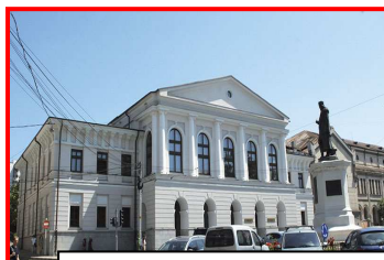
UNIVERSITATEA DE ARTE „GEORGE ENESCU” - RO